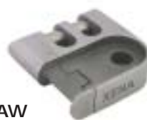
CLAW pour XN14