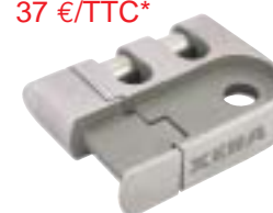
CLAW pour XN15