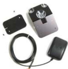
010-10052-05 Antenne GA 27C