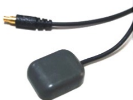
010-10702-00 Antenne MK 76