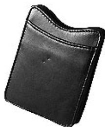
010-10723-02 Housse en cuir