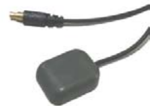
3700372300155 Antenne GPS MK 76 MCX