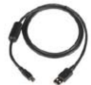
010-10477-03 Câble PC / USB