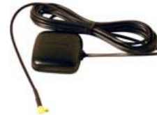
010-10702-00 GA 25 MCX : Antenne magnétique