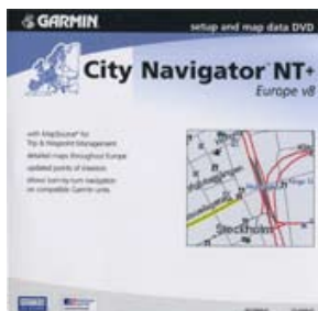
Mapsource City Navigator Europe NT+ V8

DVD de cartographie qui offre les détails cartographiques pour l'Europe de l'Ouest, qui comprennent les autoroutes, le réseau routier national et régional, les routes locales de nombreuses régions, ainsi que la possibilité de recherche d'adresses. Les centres d'intérêts apparaissent aussi sur la cartographie comme les débits d'alimentation et de boissons, les hébergements, les parkings, postes frontaliers et stations services. Cette cartographie permet d'avoir du guidage pas à pas.