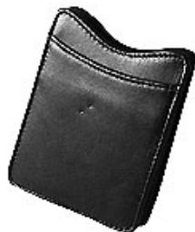
010-10723-02 Housse en cuir