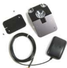
010-10052-05 Antenne GA 27C