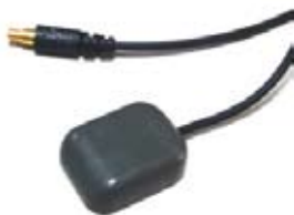
010-10702-00 Antenne MK 76